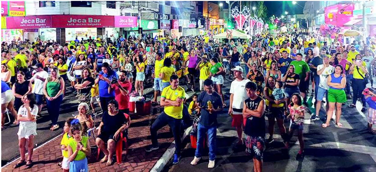
Uma multidão, nesta 5ª feira (24), ocupou o cruzamento da avenida Francisco Jales com a rua 8 e parte das duas vias, prestigiando o evento que iluminou a cidade

Fundado em 28/12/2007 – Diretor Roberto Carvalho – Jales-SP – Sábado – 26 de Novembro de 2022 – Ano 15 – Nº 750 – Circulação online