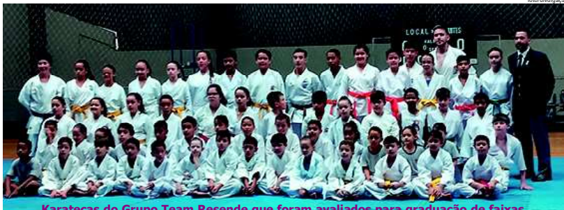
Karatecas do Grupo Team Resende que foram avaliados para graduação de faixas

O Grupo de karate Team Resende, sediado em Jales e núcleos de treinamentos nas cidades de Estrela d'Oeste, Urânia, Santa Clara d'Oeste e Santa Fé do Sul, passou nos últimos dias por avaliação de graduação de faixas.