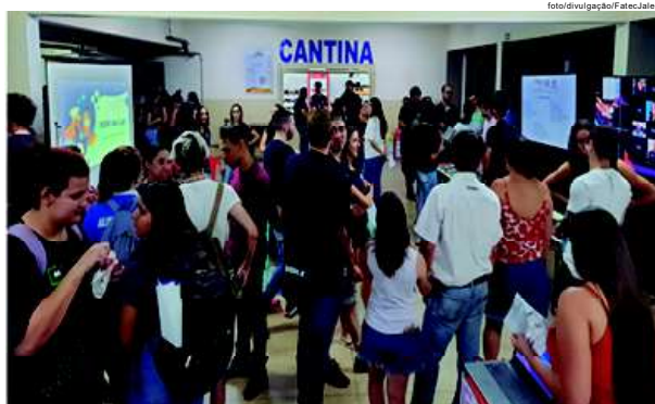
Acadêmicos divulgaram seus projetos à comunidade interna

Mais uma edição da Feni-Feira de Negócios, Ideias e Tecnologia foi realizada pela Fatec Prof. José Ca-