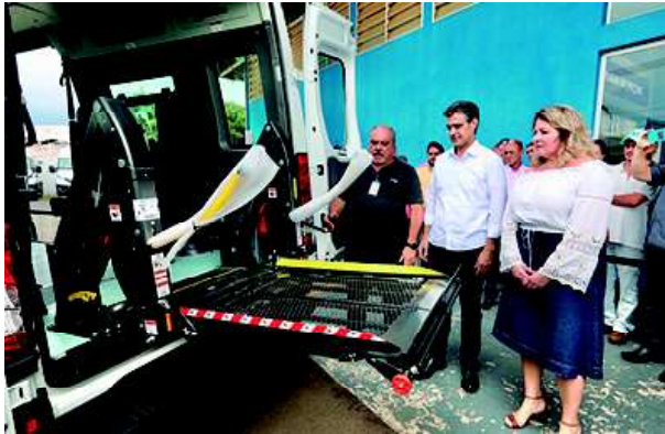
Governador Rodrigo Garcia durante a entrega vans acessíveis para os municípios