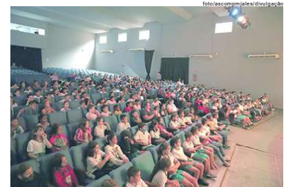
Alunos prestigiaram a 28ª Mostra nos três dias de apresentações no Teatro Municipal

Cerca de 400 alunos das escolas municipais Profª. Iracema Pinheiro Candeeo - Lola, Profª. Maria Olympia B. Sobrinho, Profª. Elza Piro Viana, Prof. Alberto Gandur, Profª. Eljácia Moreira e Profª Jacira de Carvalho da Silva, assistiram apresentações da 28ª Mostra Escola Livre de Teatro - Sê Mentes, realizada de 22 a 24 de novembro pelo Ponto de Cultura Escola Livre de Teatro, estiveram presentes no teatro assistindo a peça "Como é que a gente voa quando começa a cantar?", apresentada por crianças de 6 a 9 anos do Núcleo de Pequenos Atores e na quarta-feira (23), nova turma de alunos acompanhou o espetáculo "Zulazul", também apresentado por crianças de 10 a 12 anos do Núcleo de Pequenos Atores.