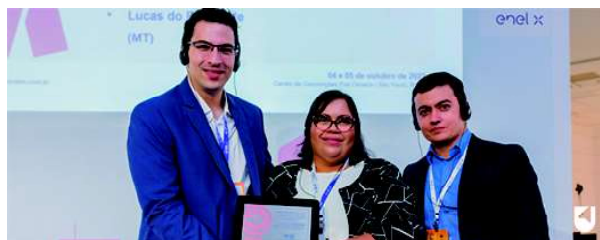
Entrega do Selo Connected Smart Cities à Prefeitura de São Luís (MA)

Os resultados do Ranking CSC, por cidade, região, porte de cidade e por estado, podem ser consultados diretamente na plataforma