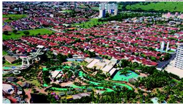
O levantamento, realizado de forma online, engloba centenas de municípios paulistas, direcionado principalmente para as Estâncias Turísticas e Municípios de Interesse Turístico.