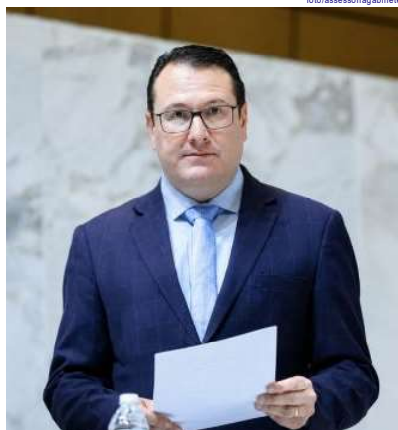
Proposta do deputado estadual Rafael Zimbaldi (União Brasil) determina que estabelecimentos sinalizem de forma clara a presença de lactose, glúten, frutos do mar, leite, ovos, soja e amendoim, entre outros alergênicos, em receitas: texto 751/2024 aguarda aval da Comissão de Defesa dos Direitos do Consumidor da Alesp

A presença de ingredientes que podem desencadear reações alérgicas ou intolerância alimentar poderá passar a ser informada de forma obrigatória nos cardápios de bares, de restaurantes, de lanchonetes, de padarias e de estabelecimentos similares em todo o estado de São Paulo. A medida está prevista num Projeto de Lei (PL) do deputado estadual Rafa Zimbaldi (União Brasil-SP).