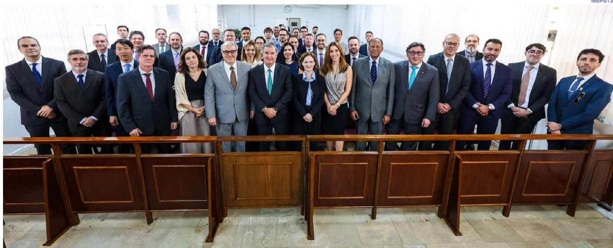
Gestão participativa reúne meia centena de magistrados da 2ª Região Administrativa – Araçatuba