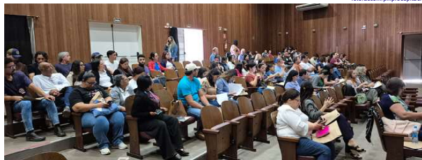
Representantes dos Grupos de Vigilância Epidemiológica das regiões de Araçatuba, Bauru, Marília, Presidente Venceslau e Jales

A Estância Turística de Presidente Epitácio sediou, na terça-feira, (7), a "Oficina de Avaliação do Plano de Ação de Leishmaniose Visceral dos Municípios Prioritários do Estado de São Paulo", promovida pela Secretaria de Estado da Saúde, por meio da Coordenadoria de