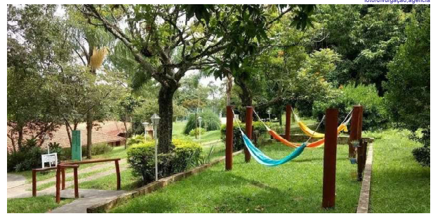
Busca por bem-estar supera interesse em emagrecimento

A proposta para atingir esse bem-estar vai além da alimentação equilibrada e inclui atividades como yoga, hidroginástica, meditação,