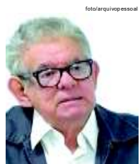
por José Reis Chaves

Embora os teólogos trinitaristas sempre se esforçam por afirmarem que as Pessoas da Santíssima Trin-