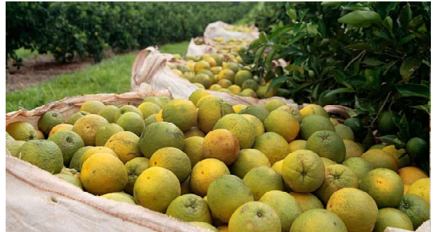
Secretaria lista cidades que têm o menor índice de greening no estado

transporte interestadual de plantas cítricas também passa por atualização. A partir de agora, passa a ser obrigatório o processamento e a escovação das frutas antes do trânsito de São Paulo para outros Estados, objetivando